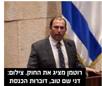
רוטמן מציג את החוק.

יהיה כבר בהשבעת הממשלה להשביע את השר הנוסף, כדי שכשהכנסת תביע אמון בממשלה היא תדע בדיוק את הרכב השרים וחלוקת הסמכויות בניהם. שר הביטחון בני גנץ השיב בשם הממשלה: "הקמת משרד בתוך משרד זה לא מומלץ בשום מובן ארגוני ובטח ובטח במה שקשור לנושאי ביטחון. מההסכמים הקואליציוניים מה שאני מבין זה שהממשלה מבקשת זה לבקש משרד הביטחון ב', לענייני יהודה ושומרון. זה תפקידה של הצעת החוק. השיעור הראשון בצבא זה אחדות הפיקוד, אין משימה עם שני מפקדים."