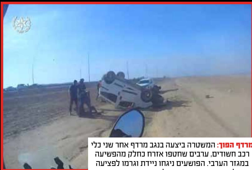
מרדף הפוך: המשטרה ביצעה בנגב מרדף אחר שני כלי רכב חשודים, ערבים שחטפו אזרח כחלק מהפשיעה במגזר הערבי. הפושעים ניגחו ניידת וגרמו לפגיעה של שני שוטרים באורח קל.