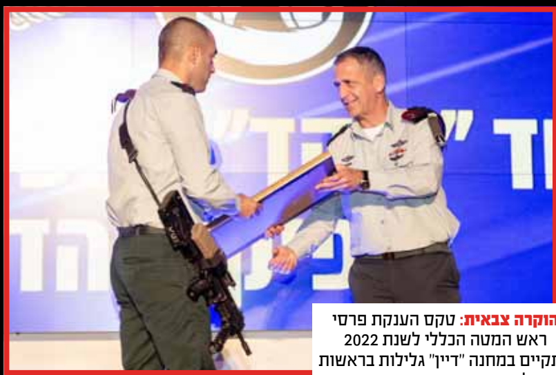
הוקרה צבאית: טקס הענקת פרסי ראש המטה הכללי לשנת 2022 התקיים במחנה "דיין" גלילות בראשות רב-אלוף אביב כוכבי.