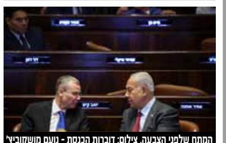
המחח שלפני הצבעה.