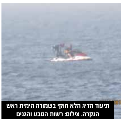
תיעוד הדיג הלא חוקי בשמורה הימית ראש הנקרה.