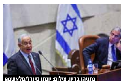
נתניהו בדיון.