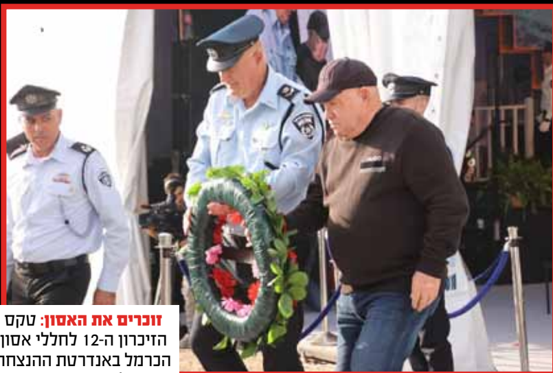
זוכרים את האסון: טקס הזיכרון ה-12 לחללי אסון הכרמל באנדרטת ההנצחה בכרמל.