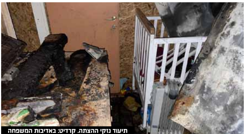
תיעוד נזקי הצתה.