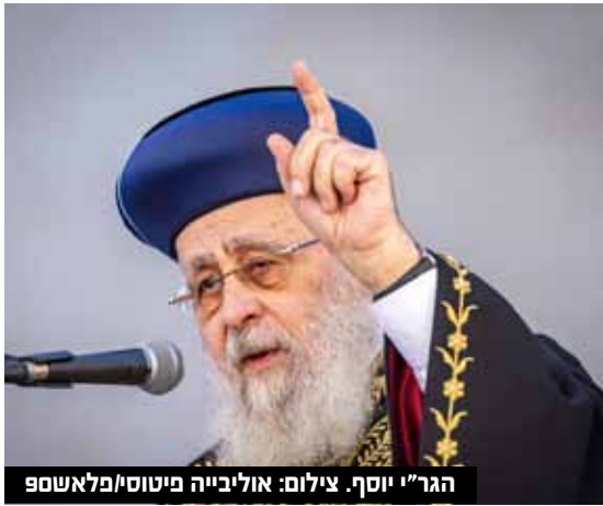
הגר"י יוסף.

בספרו המוזכר לעיל - 'שורת שיערי ציון - חלק ד' מביא רב הכותל גם את תשובותיהם של הגר"י ליברמן שליט"א מח"ס 'משנת יוסף', והגר"א שלזינגר שליט"א - רבה של גילה שגילו דעתם הנחרצת נגד הרעיון של הנשים שביקשו לערוך טקס הדלקת נר חנוכה בעזרת הנשים.