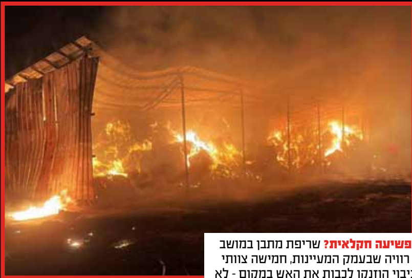
פשיעה חקלאית? שריפת מתבן במושב רוויה שבעמק המעיינות, חמישה צוותי כיבוי הוזנקו לכבות את האש במקום - לא דווח על נפגעים.