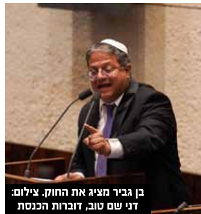
בן גביר מציג את החוק.

ח"כ בן גביר אמר: "פקודת המשטרה היא פקודה ישנה שבמדינה דמוקרטית לא יכולה להיות.