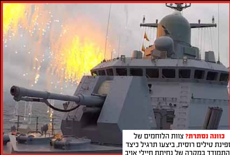
כוונה נסתרת? צוות הלוחמים של ספינת טילים רוסית, ביצעו תרגיל כיצד להתמודד במקרה של נחיתת חיילי אויב סמוך לאונייה.