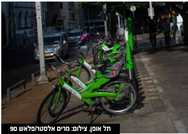
תל אופן.

למכירה לא צפויה להיות השפעה מהותית על הדוחות הכספיים של החברה.