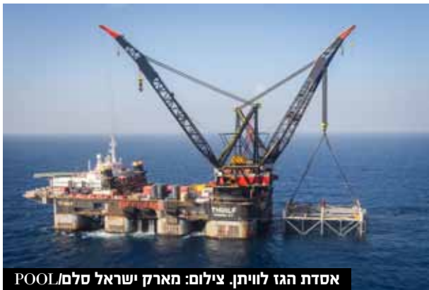
אסדת הגז לויתן.

כמו כן, ביצוע פעולות גנון קידוחים מותנה בניטור רקע וסקר סביבתי, קבלת