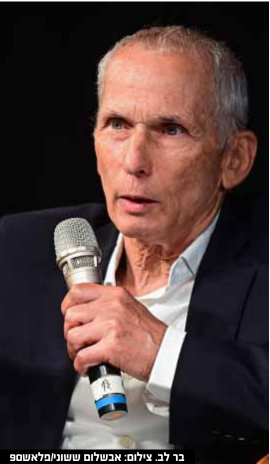
בר לב.

שעות פתיחה מיוחדות בימי החנוכה כל הסניפים מושעה: 11:00-16:00, יום שישי: 10:00-12:00 ב"ב בן יעקב 21 | ירושלים ירמיהו 24 - מתחם תנובה | בין השעות: 12:00-21:30 רצוף. בית שמש פינת נהר הירדן 30 | ביתר עילית פחד יצחק 5 | לפנה"צ 12:30-14:30, אחה"צ 17:30-21:30 אשדוד עקביא בן מהללאל 2 | לפנה"צ 11:00-13:00, אחה"צ 17:30-21:30. יום ו' כל הסניפים 10:30-12:30 טל ארצי: 1599-599-123 בתוקף עד סוף שנת המס | רשת ברודווי רשאית להפסיק את הטובעז בכל עת | ט.ל.ח. | לא כולל מומס חלק