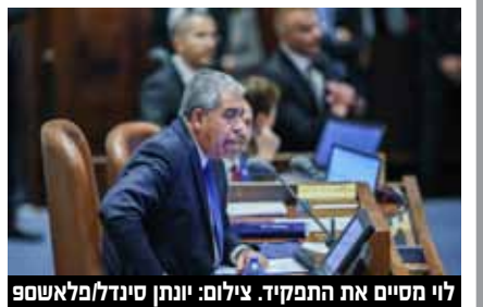
לוי מסיים את התפקיד.