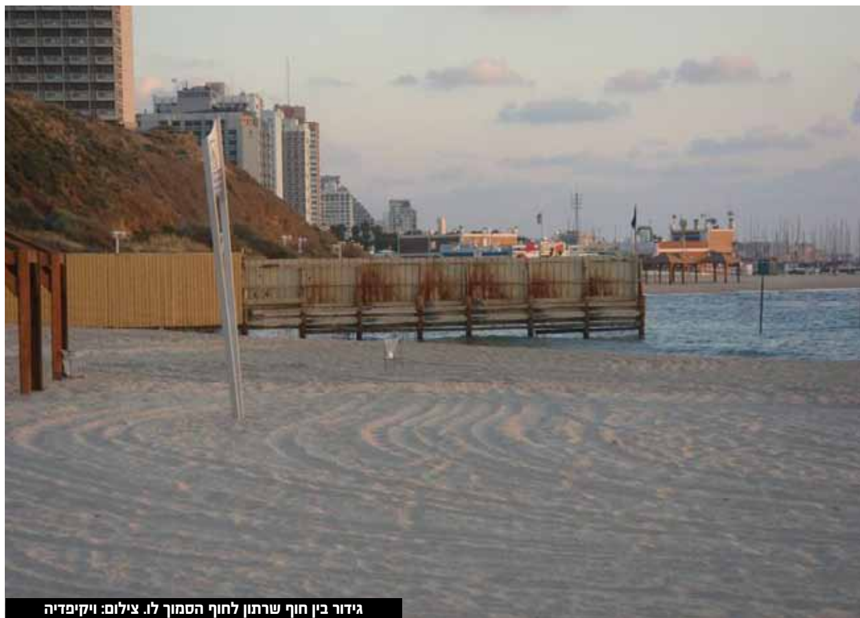
גידור בין חוף שרתון לחוף הסמוך לו.

התחקיר הביא לתגובות ולהעלאת נושא החופים הנפרדים לסדר היום הציבורי. סגן שר הפנים דאז והממונה על החופים, ח"כ יואב בן צור אמר בעקבות התחקיר כי יפעל לפתיחת חופים חדשים נפרדים ברחבי הארץ. ח"כ אליהו ברוכי מ'דגל התורה' הגיש שאלתה במליאת הכנסת