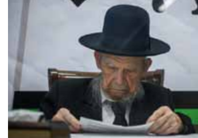
מרן רה"י.

מרן מוסיף עוד ומחדד: "ומכיון שבחנוכה הייתה הישועה שנתבטלה הגוירה וכבר היה אפשר לעסוק בתורה, מסתבר שיש בו חיוב גדול יותר לעסוק בתורה".