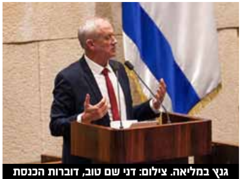
גנץ במליאה.

"מתוך הבנה עמוקה של המצב בשטח, ומתוך ראייה של אזרחי ישראל וביטחונם לפני האינטרס הפוליטי - אני מציע לך ולשותפייך לא לשחק בביטחון, ולא לבצע ניסויים שסופם חלילה להביא לפגיעה בחיי אדם. השאירו את משרד הביטחון לשר הביטחון, אל תחדירו לתוכו עצם זר שיפורר אותו ויפגע בגוף הכל כך חשוב לקיומה של מדינת ישראל."