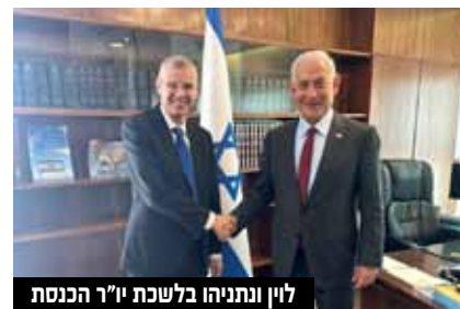
לוי ונתניהו בלשכת יו"ר הכנסת

רגע לפני ההצבעה על בחירת יו"ר הכנסת, אמר יו"ר הכנסת היוצא מיקי לוי: "אני רוצה לאחל בהצלחה ליושב-ראש הכנסת הנכנס וכולי תקווה שהוא ידע לעשות את האיוונים והבלמים הנכונים על מנת לשמור על כבוד הרשות המחוקקת. כולי תקווה