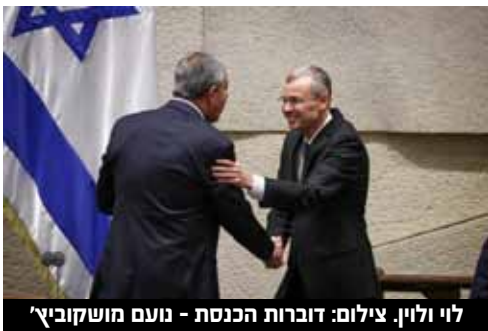
לוי ולוינ.