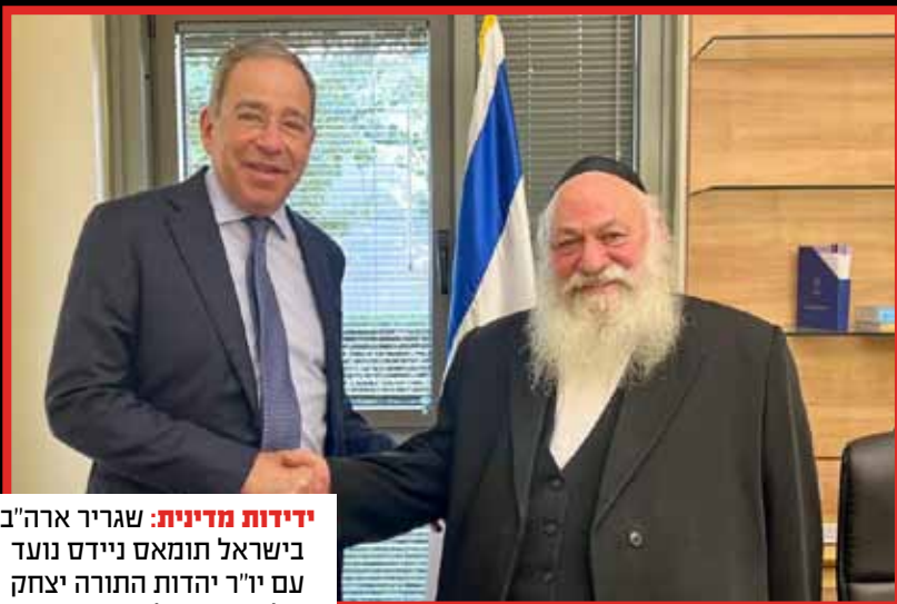
ידידות מדינית: שגריר ארה"ב בישראל תומאס נידס נועד עם יו"ר יהדות התורה יצחק גולדקנופף בלשכתו בכנסת.