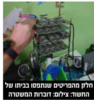
חלק מהמריטטים שנתפסו בביתו של החשוד.

ממשטרת ישראל נמסר כי "בחודשים האחרונים נאספו מאות תלונות בכל רחבי הארץ כאשר היקף המרמה מגיע לכ-70 מיליון שקלים. משטרת ישראל קוראת לציבור שלא למסור את פרטי חשבון הבנק, הקוד הסודי, או כל פרט אחר לידי אדם זר. אזרחים שסבורים כי הונאו או חשדו בדרכי דומה נקראים להגיע בהקדם לאחת מתחנות המשטרה הקרובות לביתם ולהגיש תלונה".