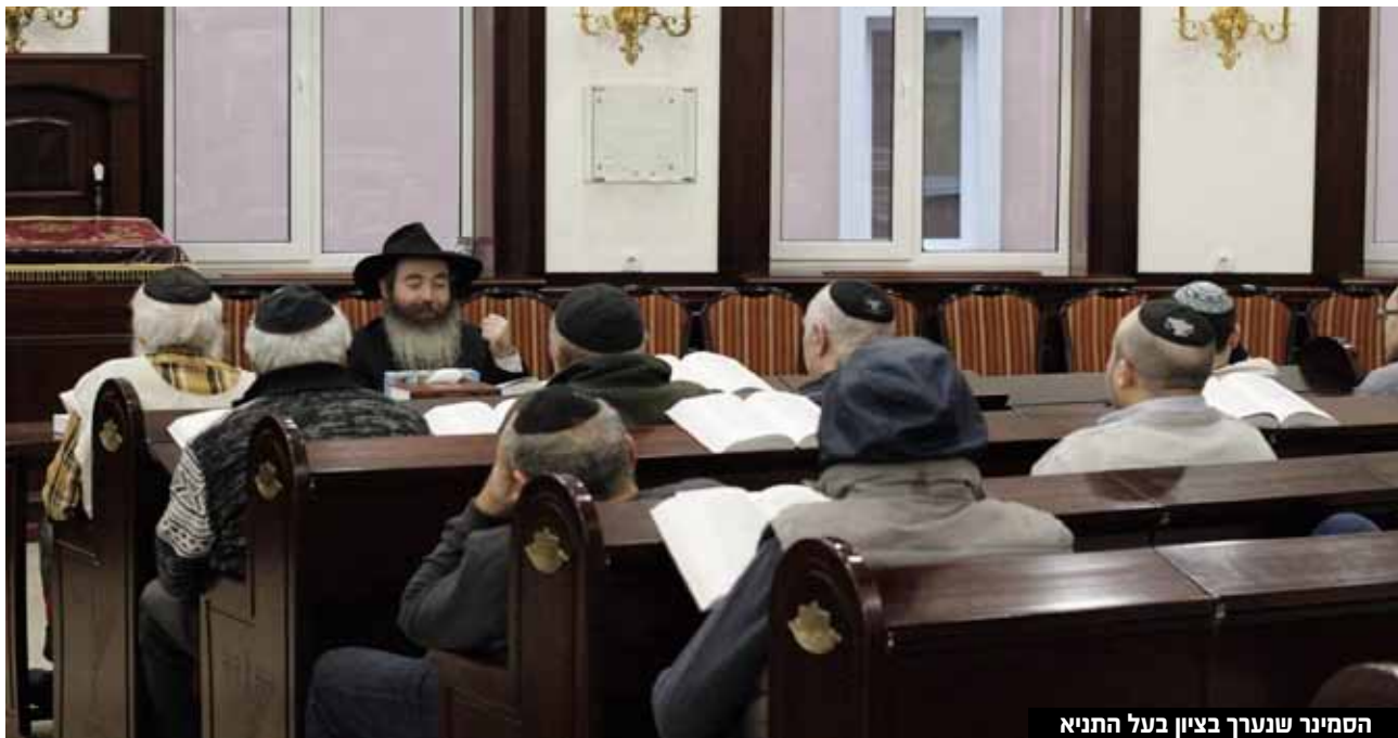
הסמינר שנערך בציון בעל התניא

בשעת לילה מאוחרת, באור ל"ט בכסלו, הסתיים הסמינר הראשון ביהדות שנערך באוקראינה מאז פרוץ המלחמה. בסמינר שנפתח בעש"ק האחרונה, פרשת וישלח השתתפו עשרות יהודים. המלחמה באוקראינה שהביאה לשבר בקהילות היהודיות ולחיי הפרט היהודיים, לא גרמה לשלוחי חב"ד הפועלים בה להרים ידיים. הפעם, אחרי המשך