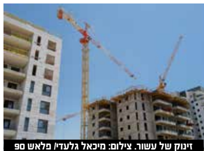
זינוק של עשור.

עלה המדד ב-0.9%. יצוין כי בחודש אוקטובר 2022 ירדו בעיקר מחירי מוצרי נפט מזוקק (ב-9.3%), מוצרי הלבשה (ב-2.1%) ומתכות בסיסיות (ב-1.2%). לעומת זאת, עלו מחירי כלי רכב מנועיים ונגררים (ב-1.8%), מחשבים, מכשור אלקטרוני ואופטי (ב-1.6%), כלי תחבורה והובלה אחרים (ב-1.6%), מכונות וציוד (ב-1.4%) וציוד חשמלי (ב-1.4%).