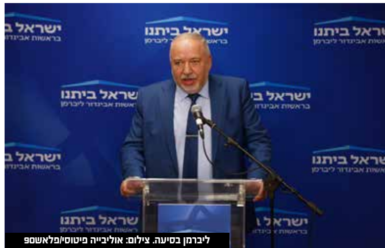
ליברמן בסיעה.

יו"ר ישראל ביתנו איווט ליברמן השתלח כדרכו בחרדים בפתיח ישיבת הסיעה ואמר: "פעם ראשונה מקום המדינה קמה קואליציה אנטי ציונית שמסדירה מעמד של משתמטים, דבר בלתי סביר בעליל". ליברמן הוסיף והסית: "הולכים להקים פה משטר של אייתולות נוסח כחול לבן. לא יכול להיות שכהני דת יתערבו בנושאי חקיקה". ליברמן אמר כי "חייבים להכניס למעגל העבודה, גברים חרדים ונשים ערביות". ליברמן התייחס גם לדרישת יו"ר הצינות הדתית בצלאל סמוטריץ' לקבל את תיק האוצר או הביטחון, ואמר כי "מינוי של סמוטריץ' לשר הביטחון זה פגיעה בביטחון לאומי". "מעולם לא שמעתי טרולול כזה, להכפיל את הקצבאות לאברכים, זה תמריץ שלילי", אמר ליברמן. "אף אחד לא ייצא לעבודה. זה דבר בלתי סביר בעליל. ומה זה לחלק מיליארד שקל בתלושי מזון? אם גם מכפילים לך קצבה, וגם מחלקים לך תלושי מזון, למה שתחפש עבודה? מה שמאיים על החברה הישראלית זה אי שוויון בנטל בביטחון - ובכלכלה. אם משהו חושב שניתן להמשיך כשיש אי שוויון בנטל כה צורם גם בביטחון וגם בכלכלה - זה לא ניתן". "דרעי, גפני וגולדקנופף לא למדו