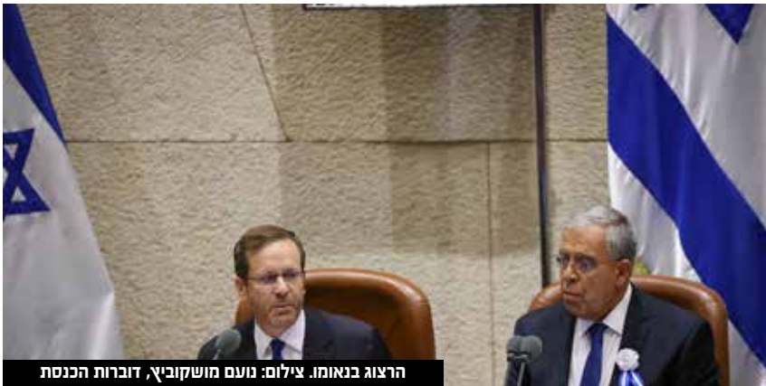
הרצוג ובנאום.