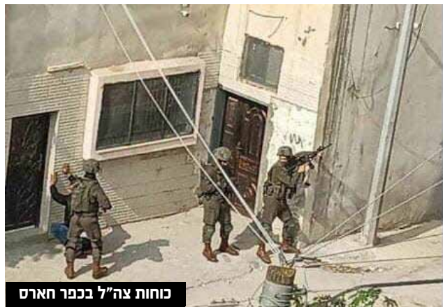
כוחות צה"ל בכפר חארס

בן דודו של המחבל נעצר על ידי כוחות הביטחון. הסיבה למעצרו הוא חשד של מערכת הביטחון ושב"כ, שאותו בן דוד היה גם זה שהסיע את המחבל לזירת הפיגוע - אך נמלט במיידית מהמקום. המחבל עצמו חוסל בזירה. "קשה מאוד עד בלתי אפשרי למנוע את הפיגוע