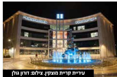
עיריית קריית מוצקין.

הכלכלית! תוצאות הדירוג משקפות את הפעולות הרבות שאנחנו מובילים בעיר לחיזוק האיתנות הכלכלית ולשמירה על ההתנהלות הנכונה של העירייה. קריית מוצקין אף זכתה לאחורונה בתואר העיר הידידותית ביותר לעסקים בשוטף וכן בזמן הקורונה. נמשיך להוביל את העיר להישגים כלכליים נוספים. מנכ"ל העירייה, יריב גר: "הדירוג מעיד על יעילות העירייה בניהול תקציבי יעיל ושקוף בו נמדדו מס' פרמטרים הנוגעים לניהול הפיננסי. עיריית קריית מוצקין עוברת בשנים האחרונות תהליכי התייעלות במגוון תחומים לצד פיתוח פרויקטים כלכליים כמו הטיילת החדשה, הקמת מתקנים פוטו-וולטאיים ופרויקטים נוספים שייצרו הכנסות ויחזקו את היציבות הפיננסית של העיר".