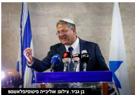
בן גביר.

של הקואליציה העתידית, בקריאה להתכנס כבר מחר, להגיע להסכמות". אילה בן גביר, רעייתו של יו"ר עוצמה יהודית ח"כ איתמר בן גביר, השתתפה בישיבת הסיעה החגיגית בכנסת לרגל השבעת הכנסת העשירי וחמש והתייחסה לתמונה בה נצפתה עם נשקה. "אני קוראת לכל אזרחי ישראל שמסוגלים לשאת נשק ויכולים מבחינה חוקית. שאו נשק, תעשו את זה בצורה מסודרת, טובה ובטיחותית. זה יכול להציל לנו את החיים". עוד הוסיפה בן גביר: "חזרנו לארץ ישראל כדי לחיות במדינה ישראל בגאווה, בבריאות, בביטחון, זה חשוב מאוד. קחו נשק!"