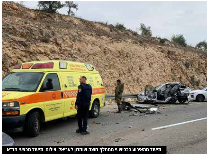
תיעוד מהאירוע בכביש 5 ממחלף חוצה שומרון לאריאל.