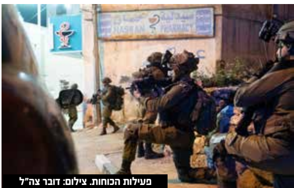
פעילות הכוחות.

מבוקשים החשודים במעורבות בפעילות טרור. לוחמי צה"ל פעלו בנוסף במרחב החטיבת המרחבית שומרון ועצרו שני מבוקשים בכפר עקרבה. כמו כן, בפעילות הכוחות בכפר אל-פציל שבחטיבת הבקעה והעמקים נעצר מבוקש אחד החשוד במעורבות בפעילות טרור. דובר צה"ל עדכן ב"ה כי אין נפגעים לכוחות, וכי המבוקשים שנעצרו הועברו להמשך חקירת כוחות הביטחון.