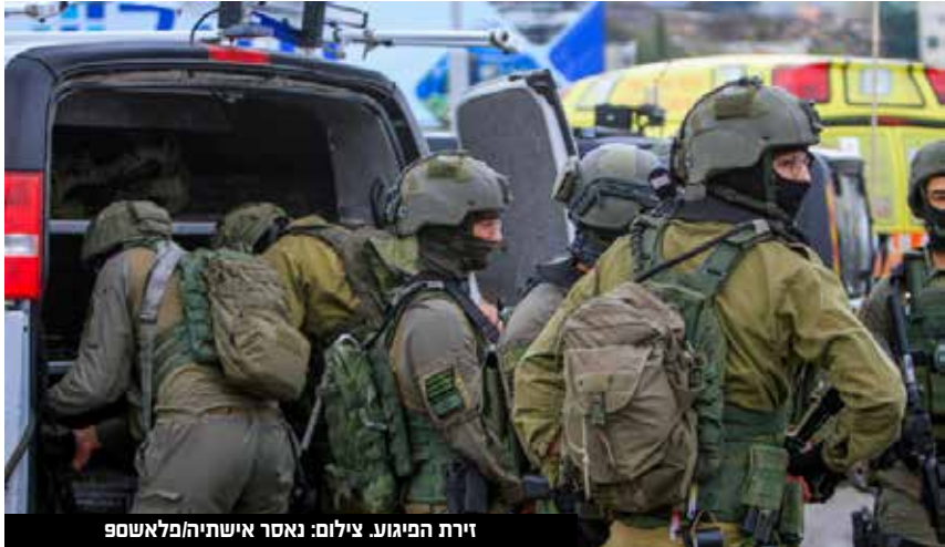
זירת הפיגוע.

מקבלים תזכורת כואבת לנושא הכי חשוב ודחוף שעל שולחנו. חייבים להחזיר את הביטחון לכל אזרחי ישראל ולהחזיר את ההרתעה שנשחקה. מאחל החלמה מהירה ורפואה שלמה לפצועים בפגיעים באריאל."