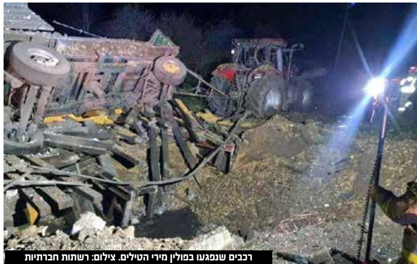
רכבים שנמגעו בפולין מיירי הטיילים.

במהלך נאומו, הציג זלנסקי את תוכנית השלום שלו עם רוסיה, שכוללת בטיחות גרעינית; בטיחות מזון; בטיחות אנרגיה; שחרור אסירים; יישום אמנת האו"ם; נסיגה של הכוחות הרוסיים והפסקת פעולות האיבה; צדק; הגנה סביבתית; מגיעת הסלמה; אישור שהמלחמה תסתיים עד סוף השנה.