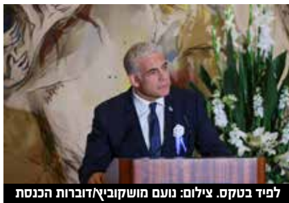
לפייד בטקס.

אירוע הצהרת האמונים של חברי הכנסת ה-25 הסתיים בצילום ראשי הרשימות המסורתי בטורקלין שאגאל: בנימין נתניהו (הליכוד), יאיר לפיד (יש עתיד), בצלאל סמוטריץ (הציונות הדתית), בני גנץ (המחנה הממלכתי), אריה דרעי (ש"ס), יצחק גולדקנופף (יהדות התורה), אביגדור ליברמן (ישראל ביתנו), מנסור עבאס (רע"מ), איימן עודה (חד"ש-תע"ל) ומרב מיכאלי (העבודה). ראשי הסיעות נעמדו זה לצד זה לתמונה משותפת עם ארבעת סמלי השלטון - יו"ר הכנסת מיקי לוי, ראש הממשלה יאיר לפיד, נשיא המדינה יצחק הרצוג ונשיאת בית המשפט העליון השופטת אסתר חיות. יו"ר הכנסת, ח"כ מיקי לוי אמר כי "היום הוא יום חגה של הדמוקרטיה הישראלית. זהו יום בו רצון הבחור מקבל ביטוי מוחשי ויום בו חברי הכנסת, מקבלים כבוד השמור למעטים - הכבוד לשרת את אזרחי מדינת ישראל. עיניו של הציבור נשואות לבית הזה ואלינו בתקווה גדולה שנעבוד קשה ונקדם את רווחתו ואת הסוגיות שהבטחנו." היו"ר פנה לח"כים והוסיף: "על כתפיכם מונחת האחריות לייצג בכבוד את כלל הדעות המגוונות המרפיבות את הפסיפס הישראלי. עליכם להיות דוגמה ומופת עבור הציבור. אין לנו את האפשרות להמתין לאחרית הימים בשביל שישכון שלום בתוכנו. בואו נביא אותו בעצמנו במעשים. לחיי הכנסת ה-25, לחיי עם ישראל, אזרחי ישראל ומדינת ישראל."