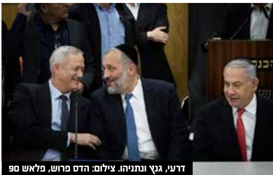
דרעי, גנץ ונתניהו.

בנימין ברגר הפלונטר במו"מ הפוליטי: העיתונאית אנה ברסקי חושפת ב'מעריב' על יוזמה בה מעורבים אנשיו של יו"ר ש"ס אריה דרעי, ואנשיו של יו"ר המחנה הממלכתי בני גנץ לצירופו של האחרון לממשלת נתניהו.