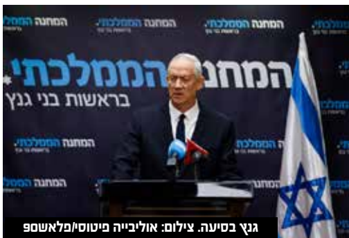
גנץ בסיעה.

"לצער, אירוע ההשבעה היום נערך ביום קשה עבורנו, אבל אני בכל זאת מבקש להביע את תקוותי שנוכל לעשות טוב ולשרת את אזרחי ישראל מהבית הזה. כן, גם אם תוצאות הבחירות מאכזבות עבורנו, נזכור שיש לנו זכות גדולה לחיות במדינת ישראל היהודית והדמוקרטית ולשרת אותה". "אני מבקש לנצל את ההזדמנות ולאחל בהצלחה לכלל חברי הסיעה, ולהודות לחברים שלא נכנסו לכנסת אך ימשיכו איתנו בדרכנו המשותפת. לאור האירועים, לא נתייחס לתוכניות שלנו ולמאבקים הפוליטיים - להם נמצא את הזמן והמקום המתאים להתייחסות", דברי גנץ.