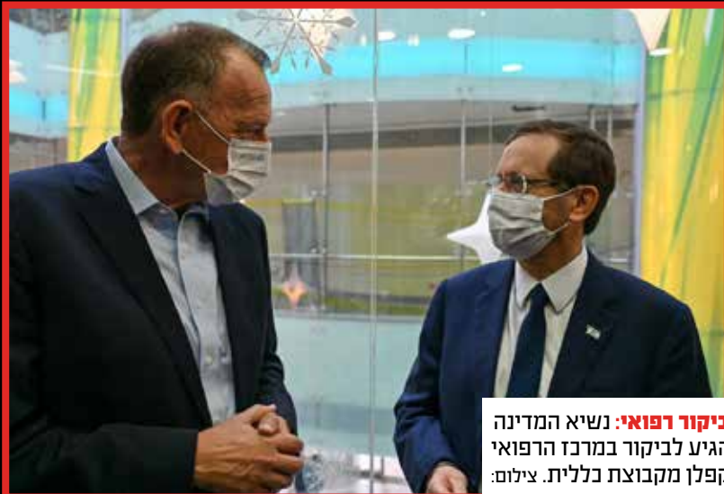
ביקור רפואי: נשיא המדינה הגיע לביקור במרכז הרפואי קפלן מקבוצת כללית.