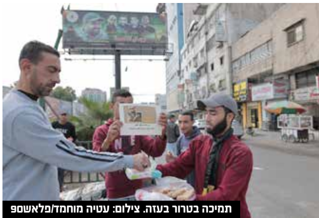
תמיכה בטרור בעזה.