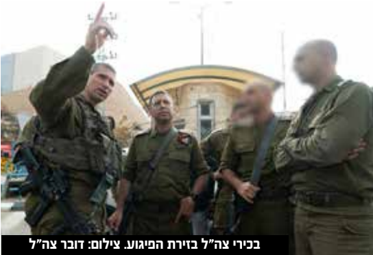
בכירי צה"ל בזירת הפיגוע.