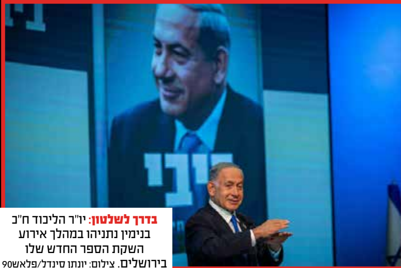
בדרך לשלטון: יו"ר הליכוד ח"כ בנימין נתניהו במהלך אירוע השקת הספר החדש שלו בירושלים.