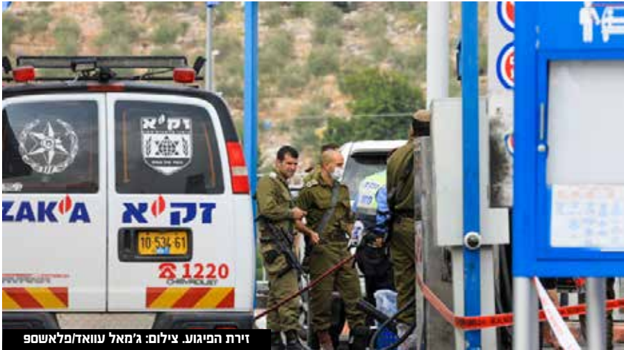
זירת הפיגוע.

עובד בתחנת הדלק סיפר: "המתדלק שהיה בתחנה נכנס פנימה לחנות וצעק 'פיגוע, פיגוע'. יצאתי החוצה ואז ראיתי את המחבל עם הסכין בורח דרך התחנה אחרי שדקר כמה אנשים"