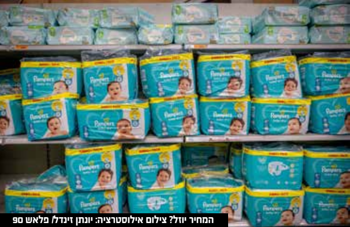
המחיר יוזל?

יאיר ויס שרת הכלכלה והתעשייה אורנה ברביבאי, חתמה על הוספת התקן הדין בחיתולים חד פעמיים לתינוקות, למסלול היבוא על בסיס תקינה בינלאומית. חתימת השרה באה בהמשך ליציאת המשרד לשימוע ציבורי ובחינת העמדות השונות שהגיעו למשרד בנושא. עד היום ניתן היה לייבא חיתולים חד פעמיים לפי תקינה ישראלית בלבד, על עמידת המוצר בה מצהיר היבואן בשער הכניסה לארץ. הצעד שנעשה הבוקר מאפשר חלופה חדשה, לפיה ניתן יהיה לייבא את המוצר בתקנה הבינלאומית. אירופה מחייבת רגולציה הכוללת עמידה במגוון דרישות הנוגעות ל חו מ ר י ס מהם מיוצרים החיתולים, כך שלא יהיו סיכון לבריאות התינוק לרבות חומרים סופגים ואריגים הבאים במגע עם העור.