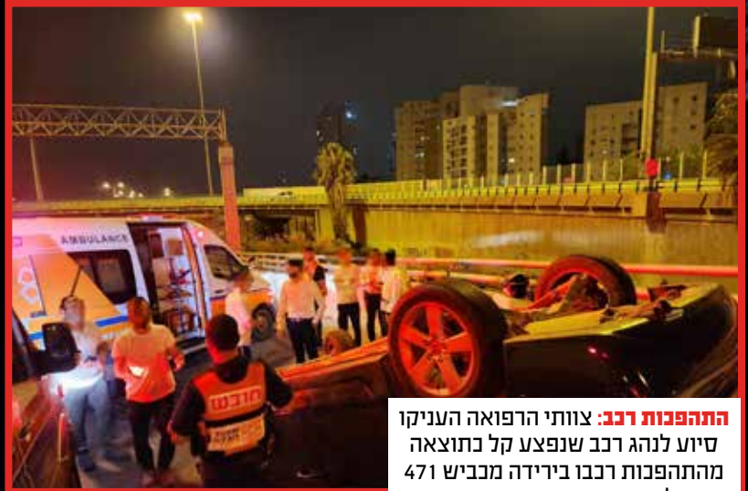
התהפכות רכב: צוותי הרפואה העניקו סיוע לנהג רכב שנפצע קל כתוצאה מהתהפכות רכבו בירידה מכביש 471 לכביש 4.