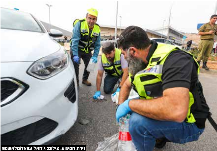
זירת הפיגוע.

מוטי בוקצ'ין דובר זק"א: "מדובר במחבל שיצא במסע רצח אכזרי, בזירה בש"ג אריאל דקר ופצע שני עוברי אורח אחד פונה במצב קשה השני פונה במצב אנוש ומותו נקבע בדרך לביה"ח. משם המשיך לתחנת דלק Ten ופגע במספר עוברי אורח נוספים, לצערי גבר בן 35 שסבל מפגיעה קשה נהרג במקום, 2 נפגעים נוספים כבן 40 וכבן 36 פונו במצב קשה לביה"ח. משם המשיך המחבל על כביש 5 והתנגש במספר כלי רכב. לצערי גבר בן 60 שכב בצד הכביש כשהוא מחוסר הכרה עם פגיעה רב מערכתית ומותו נקבע במקום. המחבל נורה בזירת התאונה ונהרג. מתנדבי זק"א צוות מחוז ש"י מטפלים בכבוד המת בזירות הקשות".