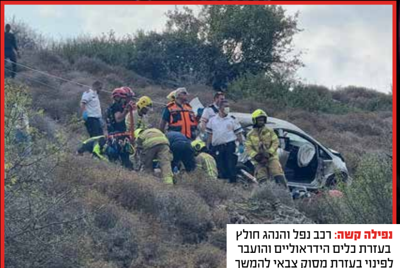
נפילה קשה: רכב נפל והנהג חולץ בעזרת כלים הידראוליים והועבר לפינוי בעזרת מסוק צבאי להמשך טיפול רפואי