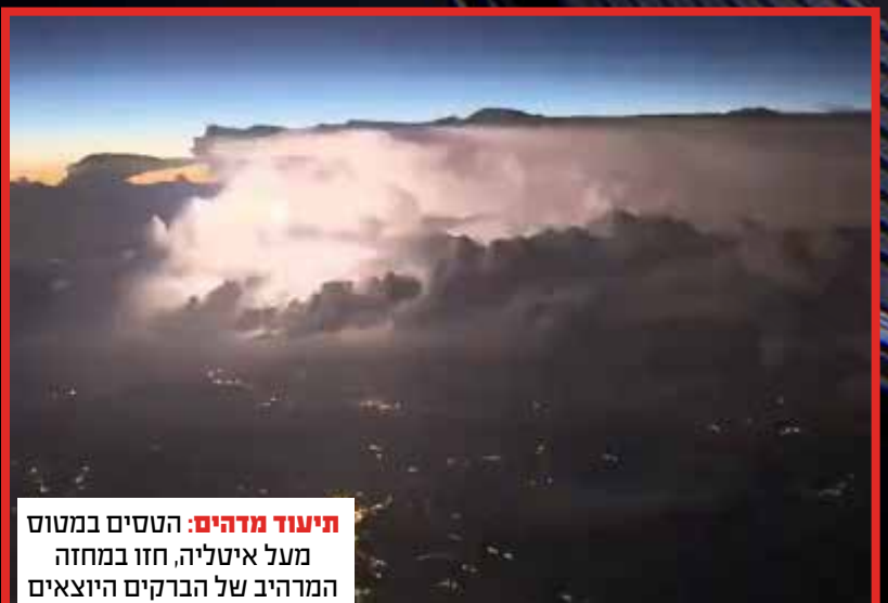
תיעוד מדהים: הטסים במטוס מעל איטליה, חזו במחזה המרהיב של הברקים היוצאים מתוך הענן - במבט מלמעלה