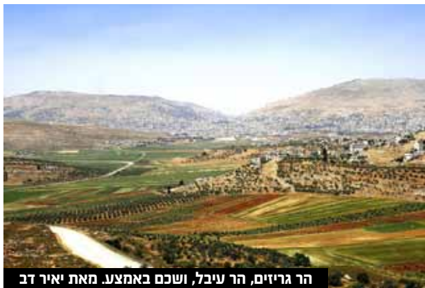
הר גריזים, הר עיבל, ושכם באמצע. מאת יאיר דב

בפרק הבא: מדוע הפלסטינים מנסים להשמיד את המקום, ולמה אין כמעט יהודים שמבקרים במקום ההיסטורי?