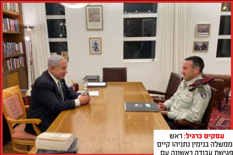
עסקים כרגיל: ראש הממשלה בנימין נתניהו קיים פגישת עבודה ראשונה עם הרמטכ"ל רא"ל הרצי הלוי.