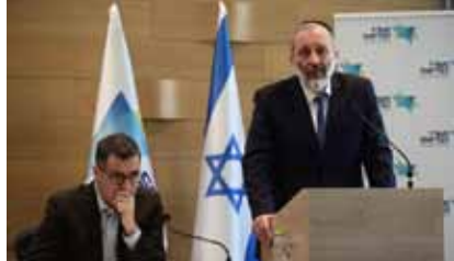
דרעי ובר סימן טוב במסיבת עיתונאים.

לדבריה, "אני סבורה שהצלחנו להשיג עדכון מגוון ומתקדם ביותר לסל הבריאות הניתן במימון ציבורי לאזרחי ישראל. בפעם הראשונה הוכללו