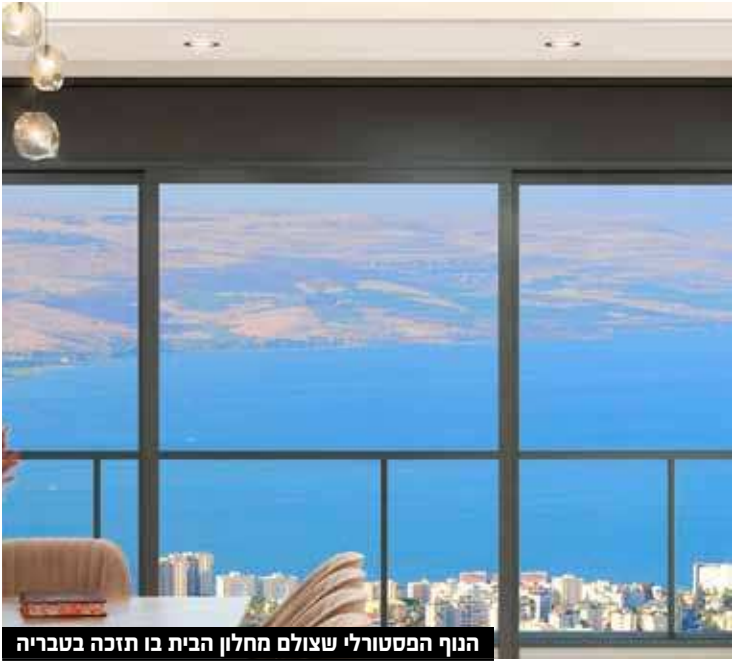
הנוף הפסטורלי שצולם מחלון הבית בו תזכה בטבריה

ההגרלה השנתית זוכה לאימון רב בקרב הציבור, כאשר לא פחות משמונה דירות הוענקו כבר לזוכים בשנים האחרונות. הזוכה המאושר יזכה בדירת שלושה חדרים שתהיה רשומה על שמו בטאבו. הדירה היא דירת נוף ממנה משקיפים בתצפית עילית על טבריה כולה עם נוף פנורמי משכר חושים אל הכינרת הכחולה הנפרשת לכל רוחב העין. לקראת הישורת האחרונה פונים הנהלת רשת כוללי צאנז 'מבצר התורה' אל כל המתמודדים כל חודש עם משכנתא לוחצת, או משלמים תשלום שכירות חודשית גבוהה, או לסתם עמך המדמיין על נכס להשקעה לחתן את הילדים, או משווע להכנסה חודשית קבועה נוספת. בקיצור לכל אלו שקשה להם כל חודש להתמודד עם התמודדות כלכלית קשה המצריכה אותם להתרוצץ ולהתאמץ.