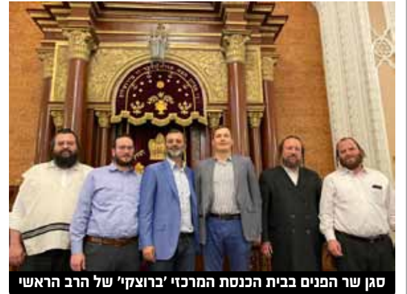
סגן שר הפנים בבית הכנסת המרכזי 'ברוצקי' של הרב הראשי

על פי הודעת המשטרה המקומית, תשעה מההרוגים היו על המסוק. 22 בני אדם נוספים נפצעו בהתרסקות ופוננו לקבלת טיפול רפואי, בהם עשרה ילדים. טרם ברור מה גרם להתרסקות המסוק. יצוין כי