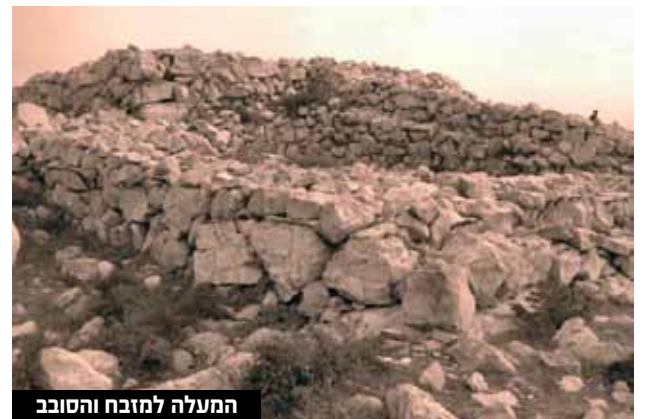
המעלה למזבח והסובב