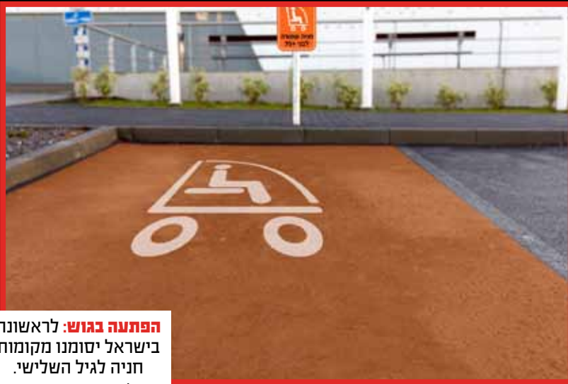
הפתעה בגוש: לראשונה בישראל יסומנו מקומות חניה לגיל השלישי.