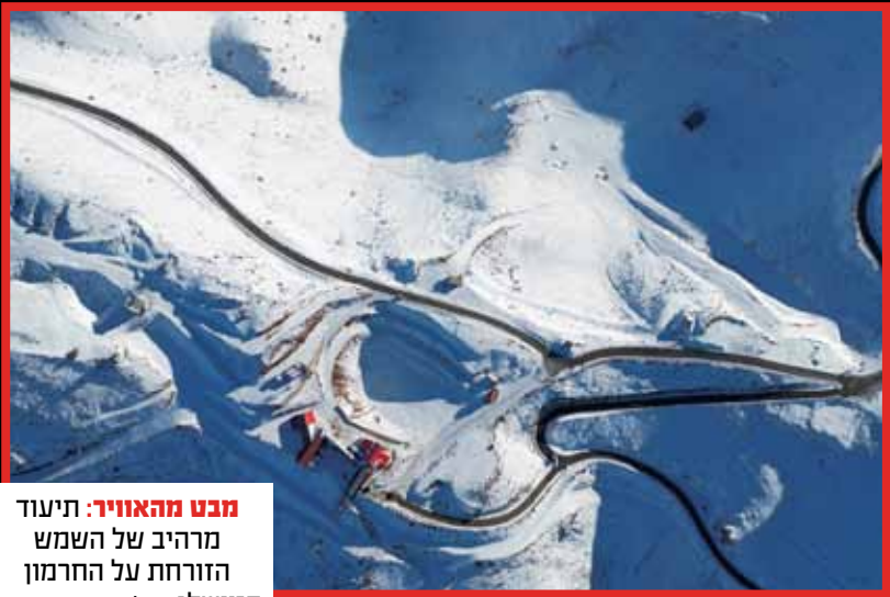
מבט מהאוויר: תיעוד מרהיב של השמש הזורחת על החרמון המושלג.