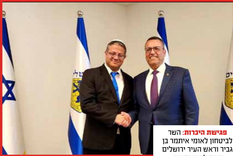
פגישת היכרות: השר לביטחון לאומי איתמר בן גביר וראש העיר ירושלים משה ליאון נפגשו.