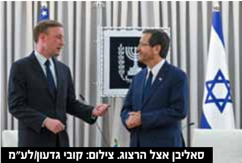
סאליבן אצל הרצוג.

נשיא המדינה יצחק הרצוג נפגש אמש עם היועץ לביטחון לאומי של ארצות הברית, ג'ייק סאליבן, שנחת הערב לביקור בישראל. זוהי פגישתם הרביעית בין נשיא המדינה והיועץ לביטחון לאומי של ארצות הברית. תחילה קיימו פגישה מדינית מורחבת בהשתתפות יועצי הנשיא והיועץ לביטחון לאומי, ולאחר מכן קיימו השניים פגישה בארבע עיניים. בפגישתם, שהתקיימה באווירה חמה, דנו בשותפות החזקה בין ישראל לארצות הברית, החוצה מפלגות וממשלות, ובדרכים להעמיק את שיתופי הפעולה האסטרטגיים בין המדינות.