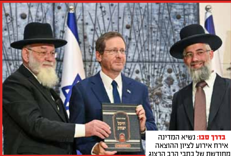
ברוך סבו: נשיא המדינה אירח אירוע לציון הוצאה המחודשת של כתבי הרב הרצוג זצ"ל.