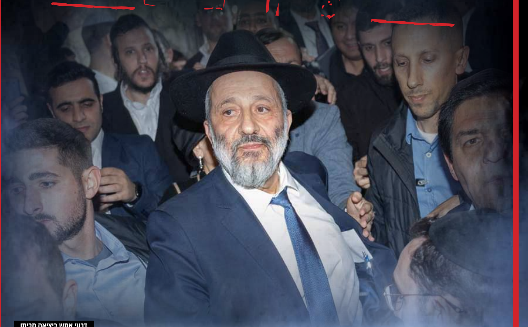
דרעו אמש ביציאה מביתו

בג"ץ קבע ברוב של 10 שופטים כי מינויו של אריה דרעי לתפקיד שר "אינו יכול לעמוד" • הנימוקים: התפרש שדרעי מתכוון לפרוש מעיסוקיו הפוליטיים וצבר הרשעותיו • השופטת חיות: "במינויו של דרעי לשר פגם של חוסר סבירות קיצוני" • השופט עמית: "400 אלף איש בחרו בש"ס, זה לא במקום דין המשפט" • השופט אלרון התנגד לבדו לפסילה: "סוגיית הקלון של דרעי נותרה ללא הכרעה" • יו"ר ש"ס דרעי הגיב: "אני מתחייב להמשיך את המהפכה. יסגרו לנו את הדלת, ניכנס דרך החלון. יסגרו לנו את החלון נפרוץ את התקרה" • מועצת חכמי התורה: "המשך להוביל את תנועת ש"ס בכל עוז ותעצומות" • ראשי הקואליציה התחייבו: "נפעל בכל דרך חוקית כדי לתקן את העוול" • הפלונטר הפוליטי: דרעי מועמד לרה"מ החליפי או יו"ר הכנסת, ומי יקבל את משרדי הפנים והבריאות?