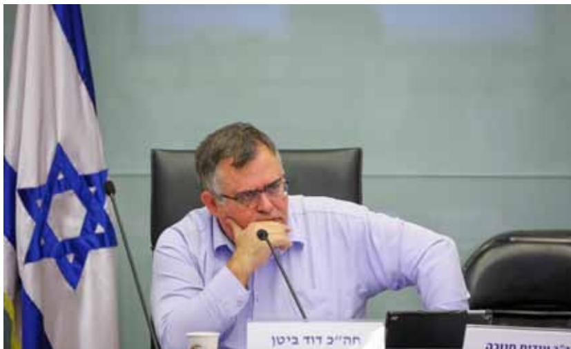
ח"כ ביטן.

בז'ה: "אתה תעזור לנו מול הפקידים שיושבים הוא הוסיף ואמר בכאב: "העצמאי הוא גורם אמורפי לא מטופל וכשאומרים החברים מהאוצר זה