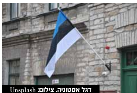
דגל אסטוניה.

ב-11 בינואר הורה משרד החוץ של אסטוניה לרוסיה לצמצם את מספר העובדים בשגרירותה בטאלין כדי "להגיע לשוויון" עם מספר העובדים בשגרירות אסטוניה