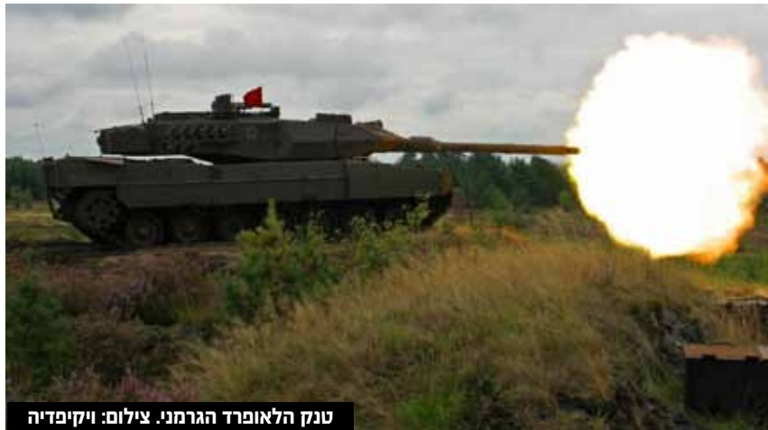
טנק הלאופרד הגרמני.

בתוך כך דובר ממשלת גרמניה אמר לעיתונאים כי ארצו לא קיבלה בקשה מפולין או מכל מדינה אחרת לאישור העברת טנקי Leopard 2 לאוקראינה - כפי שנדרש, בהתאם לחוזים הצבאיים בין המדינות. שר החוץ הפולני ראו אמר כי ארצו צפויה לבקש את