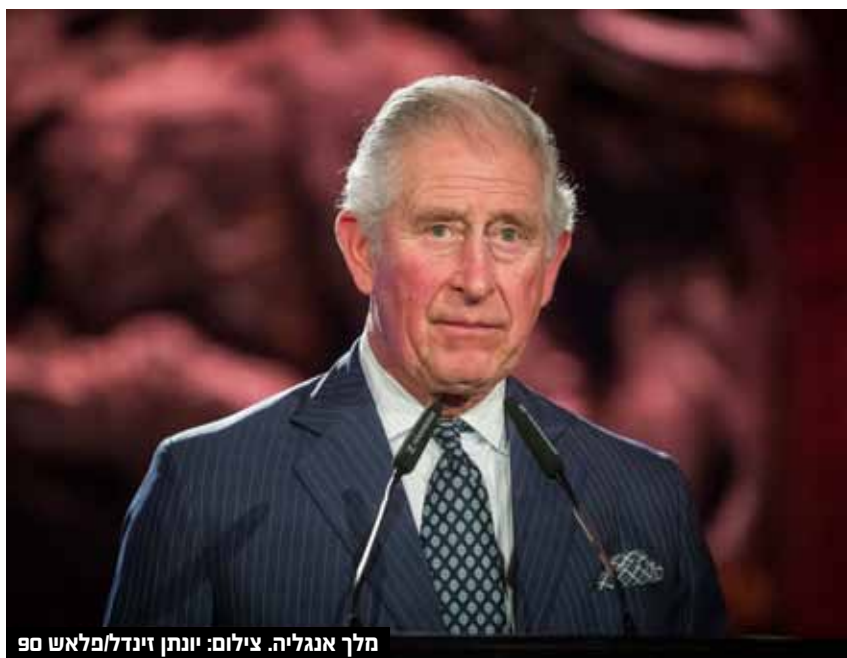
מלך אנגליה.

המדינה בתחומי המוזיקה. אחד משיאי הקונצרט יהיה כאשר במהלכו יוארו מקומות איקוניים שונים ברחבי בריטניה באמצעות הקרנות גרפיות, מופעי לייזר, ותצוגות רחפנים ותאורה. כרטיסים למופע יחולקו לציבור הרחב בחינם על ידי הגרלה בהרשמה מראש. מישל דונלאן, השרה לענייני דיגיטל, תרבות, מדיה וספורט בממשלת בריטניה, אמרה: "ההכתרה של הוד מלכותו המלך והוד מלכותה המלכה-רעיה היא אבן דרך משמעותית בהיסטוריה של בריטניה וחבר העמים. סוף השבוע יפגיש אנשים וקהילות כדי לחגוג את המלוכה ואת התערובת הייחודית של מסורת ומודרניות, תרבות וקהילה שהופכת את המדינה שלנו לגדולה".