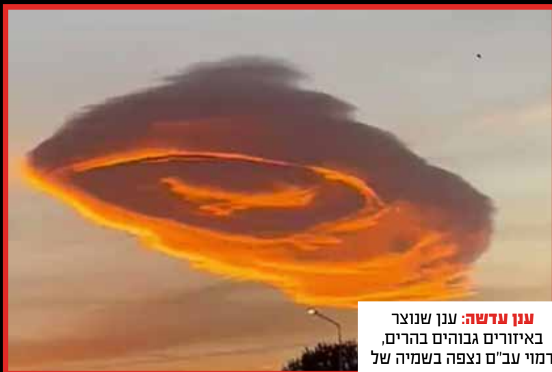
ענן עדשה: ענן שנוצר באיזורים גבוהים בהרים, דמוי ענ"ם נצפה בשמיה של העיר בורסה בטורקיה