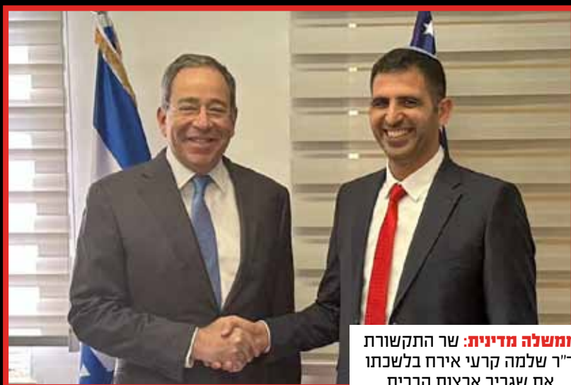
ממשלה מדינית: שר התקשורת ד"ר שלמה קרעי אירח בלשכתו את שגריר ארצות הברית בישראל טום נידס