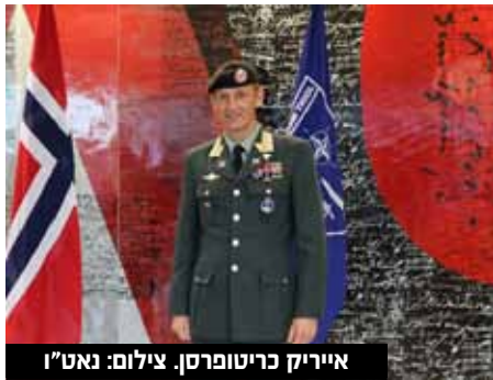
אייריק כריטופרסן.

מפקד הצבא הנורבגי אמר שלהערכתו מי שסובר שמספר ההרוגים הגבוה מצדה של רוסיה יביא לשינוי בעמדות של פוטין או לכניעה רוסיית בקרוב, טועה. "רוסיה תוכל להמשיך את המלחמה הזאת עוד זמן רב מבחינתה". לדבריו, האופציה היחידה להביא לשינוי היא לספק לאוקראינה נשק מתקדם