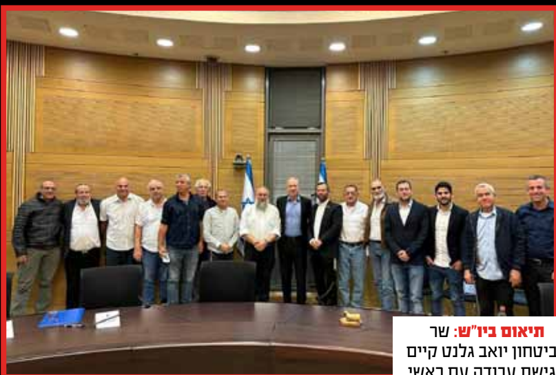
תיאום ביו"ש: שר הביטחון יואב גלנט קיים פגישת עבודה עם ראשי רשויות ביהודה ושומרון