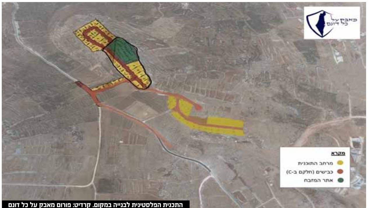
התכנית הפלסטינית לבנייה במקום.

אם יערכו במקום סיורים משמעותיים עם הסברים מותאמים לציבור החרדי על המקום, ההיסטוריה הקדומה, ומבט כללי על השטח ממנו נכנסו אבותינו אל הארץ, אמור מדריך הטיולים, המקום עשוי להצליח.