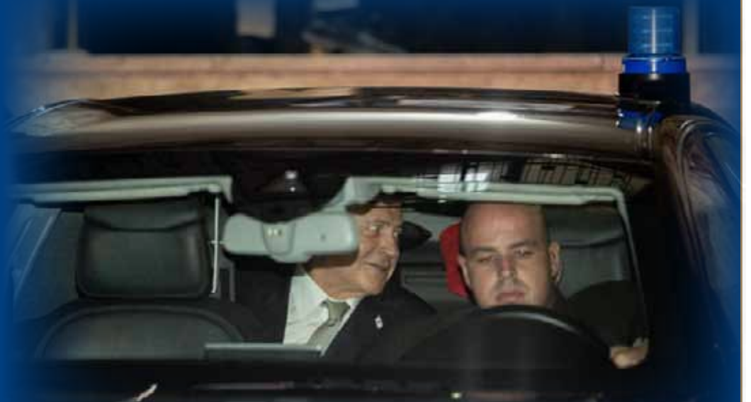
נתניהו ברכב רה"מ, בשבוע שעבר. ללא חגורת בטיחות.

בישראל ישנם שלושה שיירות של רכבים ממוגנים ומיוחדים - ראש הממשלה, נשיא המדינה ושר הביטחון • מה מכילה כל שיירה, למי יש יותר "צ'קלקות" ולמי פחות רכבים, למי הרכב ממוגן ירי ולמי הוא ממוגן גם מפני מטענים וגזים רעילים?