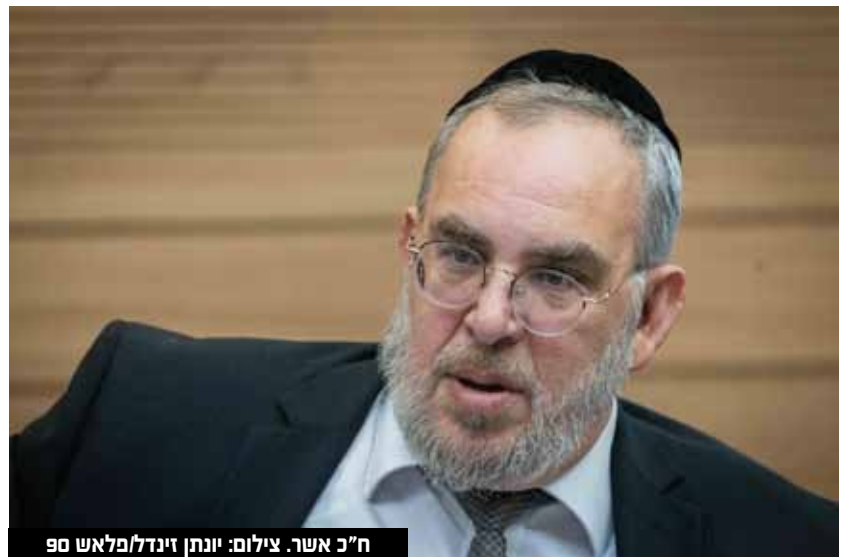
ח"כ אשר.

מענק עבודה הוא הדרך הממשלתית להיטיב עם עובדים ועובדות בעלי שכר נמוך הנמצאים מתחת לסף ההכנסה המחייבת בתשלום מס הכנסה. המענק מאפשר מתן הטבה באופן ממוקד לאוכלוסיות מוחלשות העובדות לפרנסתן, מבלי שהן ייאלצו להסתמך על גמלאות וקצבאות. הזכאות לקבלת ההטבה האמורה בנויה מפרמטר של רמת