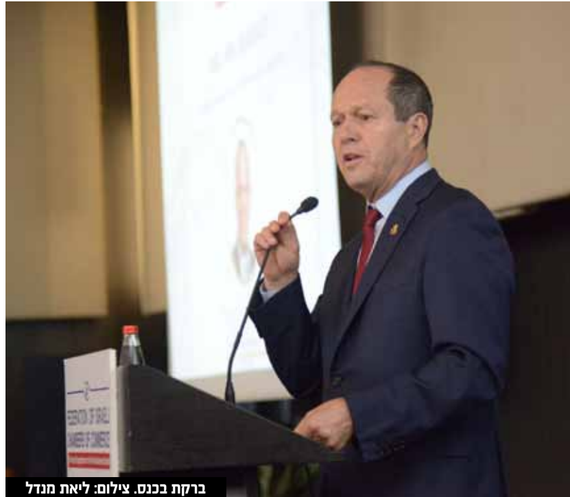
ברקת בכנס.

מאמץ את התקינות והרגולציה באיחוד האירופי, תקטין בירוקרטיה ותשדרג את הכלכלה הישראלית. המאזן המסחרי של ישראל עומד על 20 מיליארד דולר, ישראל במקום השני בעולם בייצוא שירותים, צריך להבין שהכלכלה הישראלית בשינוי היסטורי". השר ברקת אמר בכנס כי "המטרה הראשונה של הממשלה החדשה בישראל היא לא להפריע ליזמים ולמגזר העסקי אנחנו מחויבים להקשיב להם. בנוסף, ישראל תאמץ סטנדרטים גלובליים של תקינה ורגולציה. לתת למסחר החופשי לפרוח, לפתוח הזדמנויות נוספות בעולם. יוקר המחיה בישראל גבוה מאוד ביחס למדינות ה-OECD וזה מה שמעסיק הכי הרבה את הציבור בישראל. רה"מ נתניהו, שר האוצר סמוטריץ' ואני רואים עין בעין מה הם הצעדים שצריך לבצע. לשכת המסחר היא שותפה של ממשלת ישראל במאבק ביוקר המחיה, בהגברת התחרות בכלכלה הישראלית והגדלת הסחר מול המדינות שנציגיה נוכחים כאן באולם. הכלכלה הישראלית תמשיך להפוך את העולם למקום טוב יותר". בנוגע לרפורמת התמרוקים, אמר צביקה שווימר, מנכ"ל אלקטרה מוצרי צריכה: "אני מאמין שהעמיד נמצא בשת"פ כלכלי עם חברות בינ"ל כמו שעשינו עם קארפור וסבן אילבן. הצרכנים הישראלים ירגישו זאת במחירים כבר בקרוב". בנוגע לפתיחת סניפי קארפור, שווימר הודיע כי בכונת החברה לפתוח 50 סניפים של הרשת, בבת אחת וביום אחד.