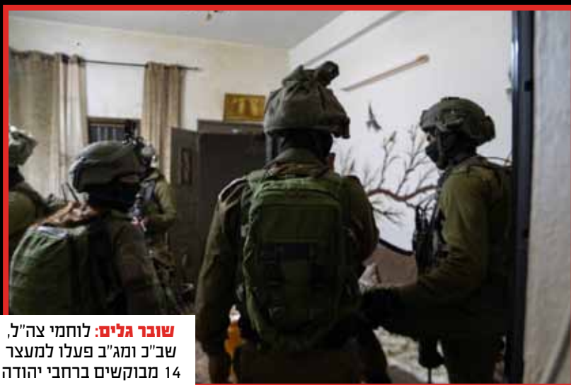
שובר גלים: לוחמי צה"ל, שב"כ ומג"ב פעלו למעצר 14 מבוקשים ברחבי יהודה ושומרון.