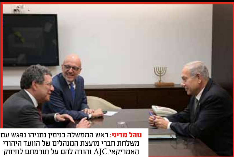
נוהל מדיני: ראש הממשלה בנימין נתניהו נפגש עם משלחת חברי מועצת המנהלים של הוועד היהודי-האמריקאי AJC והודה להם על תורמתם לחיזוק הקשר בין ישראל לארה"ב.