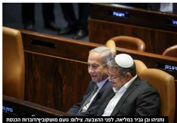
נתניהו ונב ברק במליאה, לפני ההצבעה.

בנימין ברגר מליאת הכנסת אישרה בקריאה שנייה ושלישית את הצעת חוק-יסוד הכנסת, הפסקת חברות בכנסת של שר או סגן שר, מטעם ועדת חוקה. למעשה מדובר בהרחבת החוק הנורווגי. 65 ח"כים תמכו בהצעת החוק מול התנגדותם של 18 ח"כים. הח"כים גדעון סער ונעמה לוימי מהאופוזיציה הצביעו בטעות בניגוד לעמדת האופוזיציה, ותמכו בחוק.