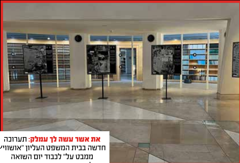
את אשר עשה לך עמלק: תערוכה חדשה בבית המשפט העליון "אושויץ ממבט על" לכבוד יום השואה הבינלאומי.