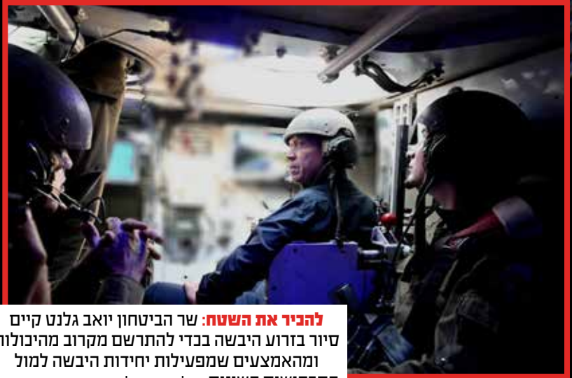
להכיר את השטח: שר הביטחון יואב גלנט קיים סיור בזרוע היבשה בכדי להתרשם מקרוב מהיכולות ומהאמצעים שמפעילות יחידות היבשה למול התרחישים השונים.