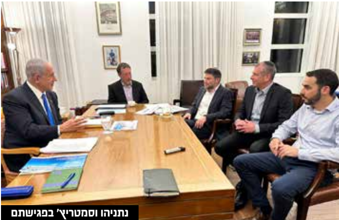
נתניהו וסמוטריץ' במשימתם

הנגיד ירון שיקף לראש הממשלה סוגיות שונות שעלו בהקשר הישראלי בדיונים שקיים עם בכירי הכלכלה העולמית ועם בכירי חברות הדירוג בשבועות האחרונים.