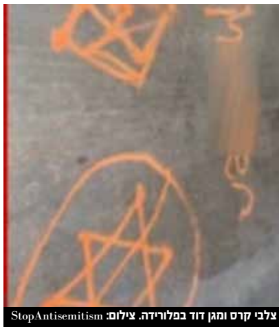
צילום: קרס ומגן דוד בפולין.