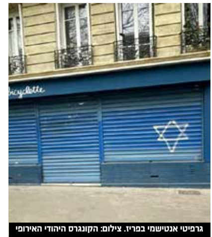
גרפיטי אנטישמי במרי.