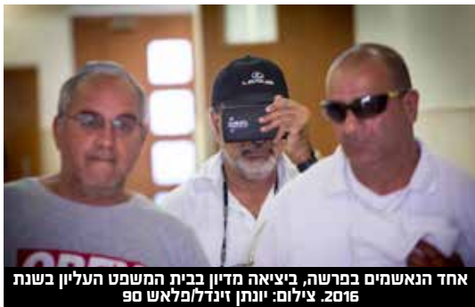
אחד הנאשמים בפרשה, ביצואה מדין בבית המשפט העליון בשנת 2016.

לאחר מתן פסק הדין אמרה הממונה על התחרות כי "בית המשפט העליון שב ומדגיש את חומרת העבירות על חוקי התחרות ואת הקו הברור שהתווה לפני מאסרים בפועל יהיו העונש ההולם עבירות אלה. רשות התחרות תמשיך לאכוף את דיני התחרות ולפעול להענשת עוברי העבירות בחומרה". חקירת רשות התחרות החלה בשנת 2013, וכללה מעצרים של חלק מהמעורבים.