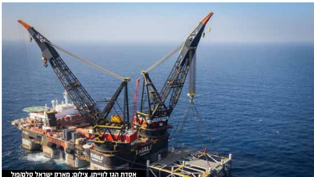
אסדת הגז לווייתן.

רווחי נפט ורווחי יתר ממשאבי טבע המיועדים לקרן לאזרחי ישראל, בעלי זכות נפט ובעלי זכות לניצול נכנסים לתקציב המדינה בשוטף.