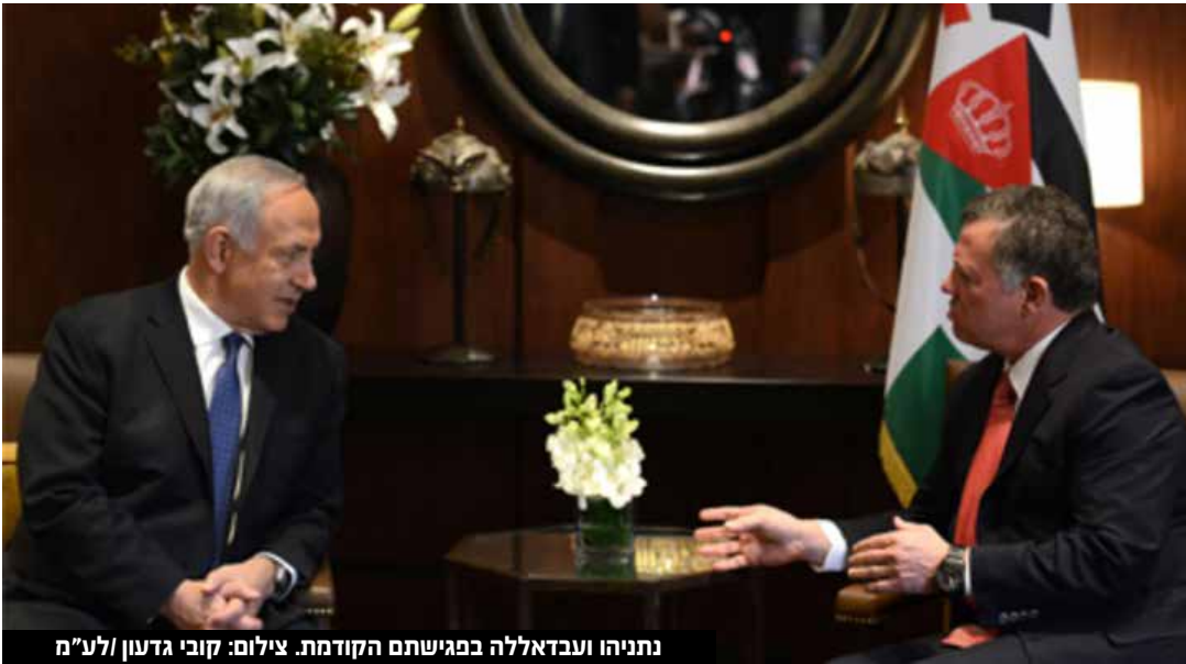
נתניהו ועבדאללה בפגישתם הקודמת.

ראש הממשלה בנימין נתניהו טס לירדן לפגישה עם מלך ירדן עבדאללה השני. מלשכת ראש הממשלה נמסר כי "שני המנהיגים דנו בסוגיות אזוריות, בדגש על שיתוף הפעולה האסטרטגי, הביטחוני והכלכלי בין ישראל לירדן, התורם ליציבות האזור. כמו כן, ברכו השניים על הידידות והשותפות, ארוכת השנים, בין מדינת ישראל לממלכה הירדנית". בבית המלוכה הירדני דווח כי המלך עבדאללה השני נפגש עם רה"מ נתניהו ברבת עמון, "במהלך הפגישה המלך הדגיש כי יש לכבד את הסטטוס קוו ההיסטורי והחוקי הקיים במסגד אל-אקצא ולא לפגוע בו". "המלך הדגיש כי יש להתחייב לרגיעה ולעצור את פעולות האלימות על מנת לפתוח אפשרות לאופק מדיני לתהליך השלום והדגיש כי יש לעצור כל פעולות שעלולות להכשיל את הסיכוי לשלום. המלך הדגיש את עמדת ירדן היציבה התומכת בפתרון שתי המדינות באופן שיבטיח הקמת מדינה פלסטינית עצמאית בגבולות 4 ביוני '67 שבירתה מזרח ירושלים כך שתחיה בשלום ובביטחון לצד ישראל", נכתב. עוד נכתב כי "השניים דנו ביחסים הביטחוניים ובחשיבות שהצד הפלסטיני ירוויח מהפרויקטים הכלכליים והאזוריים. בפגישה נכח שר החוץ הירדני איימן א-ספדי, לצד משלחת ישראלית". פקיד ישראלי בכיר אמר, כי הפגישה בין נתניהו