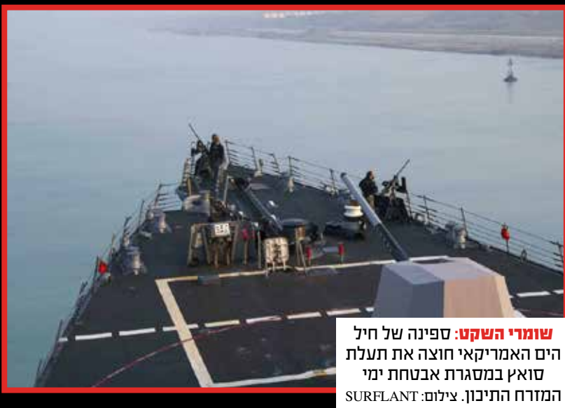
שומרי השקט: ספינה של חיל הים האמריקאי חוצה את תעלת סואץ במסגרת אבטחת ימי המזרח התיכון.