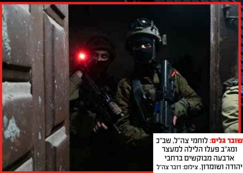
שובד גלים: לוחמי צה"ל, שב"ב ומג"ב פעלו הלילה למעצר ארבעה מבוקשים ברחבי יהודה ושומרון.