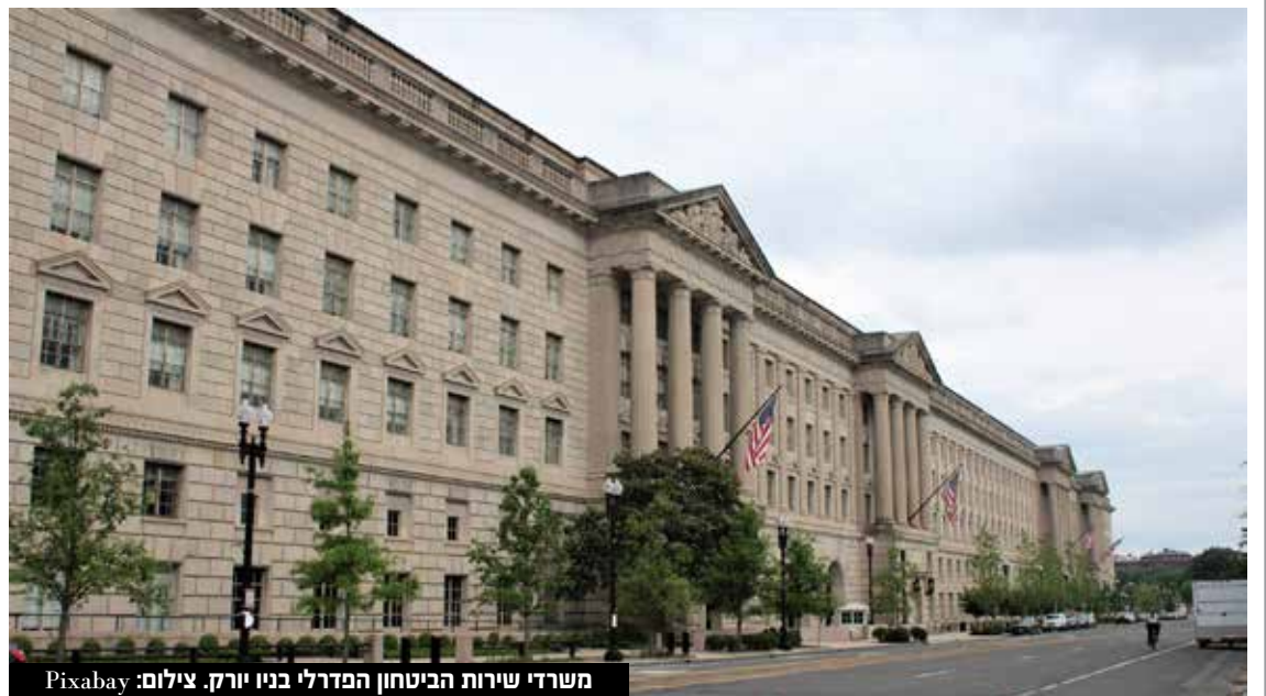
משרדי שירות הביטחון הפדרלי בניו יורק.