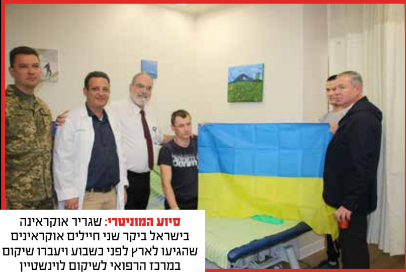
סיוע המוניטרי: שגריר אוקראינה בישראל ביקר שני חיילים אוקראינים שהגיעו לארץ לפני כשבוע ויעברו שיקום במרכז הרפואי לשיקום לוינשטיין