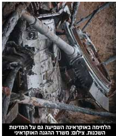
הלחימה באוקראינה השפיעה גם על המדינות השכנות.