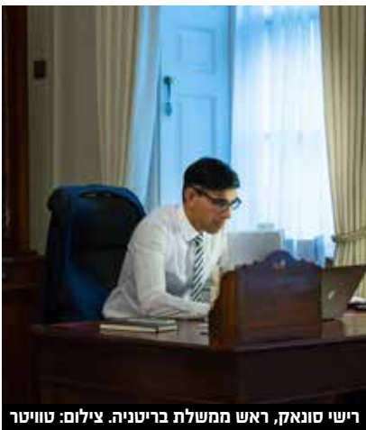
רישי סונאק, ראש ממשלת בריטניה.

בנוגע לדרום אמריקה, תופעת האנטישמיות משתנה בין האזורים השונים ברחבי היבשת, כאשר דיווחים רבים אינם מגיעים לידי הקהילות היהודיות. עם זאת, קיים שינוי לחיוב בשנה האחרונה לאור חקיקה חובבת במדינות באזור, אך לאור המצב הכלכלי והאינפלציה הגואה באזורים מסוימים ניתן לראות להבחין כי לנושא הכלכלי כקרקע פורייה לאנטישמיות בעתיד.