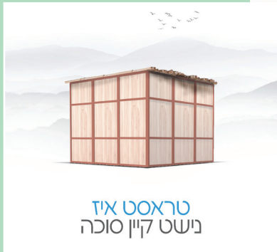
טראסט איז נישט קיין סוכה

'טראסט איז נישט קיין סוכה! אזוי! גראדע ביי אונז אידן איז סוכה דער סימבאל פון טראסט, דער סימבאל פון צלא דמהימנותא וואו מען ווייזט ארויס אונזער שטארקייט פון אמונה אין בורא כל עולמים! און בכלל, דער גאנצער עד פארנעמט א גרויל אין א אידיש הארץ.